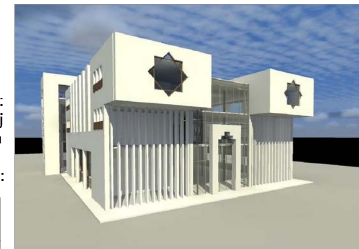
avgust 2011 PREDLOG

Skupština glavnog grada Podgorice Odluka o izmjenama i dopunama UP "Stara varoš - dio zone B" u Podgorici Br. Podgorica,